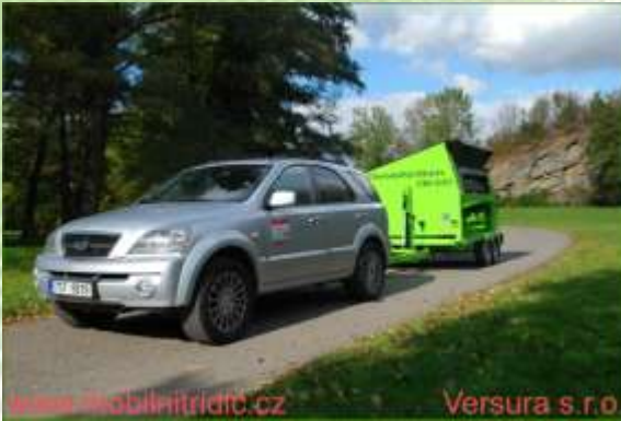
Pracovní pozice stroje